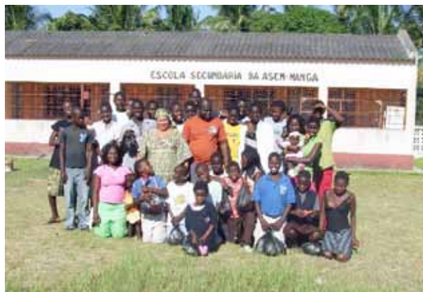
Festa di Natale al Centro di Manga